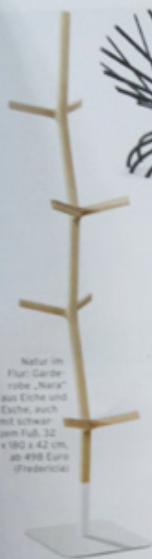
Natur im Flur: Garderobe „Nara“ aus Eiche und Esche, auch mit schwerem Fuß, 32 x 180 x 42 cm, ab 498 Euro (Fredericia)