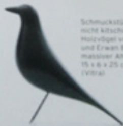
Schmuckstücke: Gar nicht kitschig sind die Holzvögel von Ronan und Erwan Bouroullec, massiver Ahorn, 15 x 6 x 25 cm, 95 Euro (Vitra)