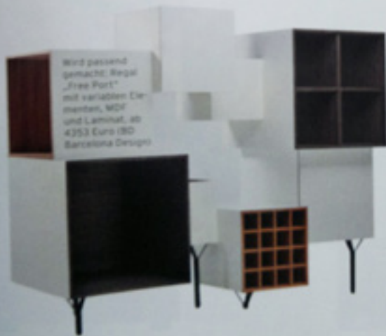
Wird passend gemacht: Regal „Free Port“ mit variablen Elementen, MDF und Laminat, ab 4253 Euro (BO Barcelona Design)