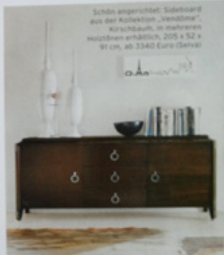
Schön angerichtet: Sideboard aus der Kollektion „Vendôme“, Kirschbaum, in mehreren Holzfarben erhältlich, 205 x 52 x 91 cm, ab 3340 Euro (Selva)

D ie Mailänder Möbelmesse „I Saloni“ ist ein Erlebnis. Tausende pressen sich freiwillig allmorgendlich in enge U-Bahnen oder Busse, um die heißesten Möbel und Hersteller in den Messehallen am Stadtrand zu bestaunen. Neben der regulären Ausstellung gingen einem in diesem Jahr bei der „Euroloce“ gleich mehrere Lichter auf. Und der „Salone Ufficio“ präsentierte das Neueste rund um Büromöbel. Auch die DECO-Redaktion hat sich für Sie ins Gerümmel gestürzt und kam mit Taschen voller Trends zurück. Ob puristisches Weiß und Schwarz, abgestrepte Polster, filigrane Strukturen aus Metall und Holz oder Farbe satt – die Möbelwelt gibt sich vielseitig. Entdecken Sie die besten Tröpschen des Jubiläumsjahrgangs!