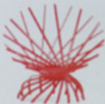
Frei wie ein Vogel fühlt man sich auf Sessel „Nest“, aus Eiche, Esche oder Buche, Farbe frei wählbar, 103 x 104 x 100 cm, Preis auf Anfrage (Markus Johansson)

D ie Mailänder Möbelmesse „I Saloni“ ist ein Erlebnis. Tausende pressen sich freiwillig allmorgendlich in enge U-Bahnen oder Busse, um die heißesten Möbel und Hersteller in den Messehallen am Stadtrand zu bestaunen. Neben der regulären Ausstellung gingen einem in diesem Jahr bei der „Euroloce“ gleich mehrere Lichter auf. Und der „Salone Ufficio“ präsentierte das Neueste rund um Büromöbel. Auch die DECO-Redaktion hat sich für Sie ins Gerümmel gestürzt und kam mit Taschen voller Trends zurück. Ob puristisches Weiß und Schwarz, abgestrepte Polster, filigrane Strukturen aus Metall und Holz oder Farbe satt – die Möbelwelt gibt sich vielseitig. Entdecken Sie die besten Tröpschen des Jubiläumsjahrgangs!